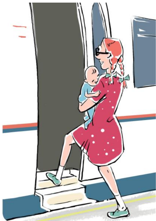
Садитесь или выходите из вагона, держа детей за руку или на руках

Помогайте пожилым людям, беременным, гражданам с детьми и людям с ограниченными физическими возможностями