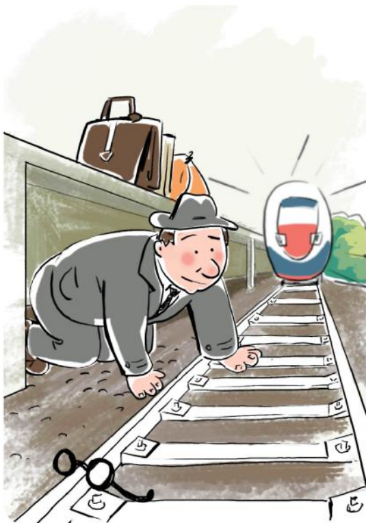
Не подлезайте под платформы и железнодорожные составы!